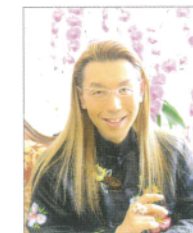
假屋崎 省吾 様

華道家。假屋崎省吾 花・ブーケ教室主宰。美輪明宏氏より「美をつむぎ出す手を持つ人」と評され、繊細かつ大胆な作風と独特の色彩感覚には定評がある。神田うの氏、小池栄子氏の結婚披露宴における会場装飾、ブーケを担当。日仏交流150周年フランス広報大使、オランダチューリップ大使を務めるなど、内外のVIPからも高い評価を得ている。近年では新たな取り組みとして、花と建造物のコラボレートとなる個展“歴史的建造物に挑む”シリーズも開催。これまでに、福岡県飯塚市「旧伊藤伝右衛門邸」、佐賀県鹿島市「肥前浜宿 酒蔵通り」、大分県日田市「草野本家」などにて行われ好評を博しており、1月15日から2月21日まで、3回目を迎えた、徳島県美馬市「吉田家住宅」と、3月12日から3月17日まで、京都府京都市「長楽館」にて開催し、昨年に引き続き、6月26日から7月11日まで、長野県軽井沢町「軽井沢タリアセン内 旧朝吹登水子邸 睡鳩荘」でも開催される。3月19日から4月18日の期間で開催された、ベルギー赤坂「桜まつり(仮称)」では、8階の花教室スペースにて、生徒による「假屋崎省吾 花・ブーケ教室展」を開催。毎秋に行われる目黒雅叙園百段階段での個展「華道家 假屋崎省吾の世界」および「假屋崎省吾 花・ブーケ教室展」はライフワークとなっている。2010年秋には、ローマ国際映画祭、フランスパリにて個展を開催予定。著書に『花筐(はながたみ)』『花暦』(メディアファクトリー)『假屋崎省吾の百花絢爛』『假屋崎省吾 一世一代のブーケ』(講談社)『花』假屋崎省吾の世界』(山と溪谷社) 本人の演奏曲も含む、新譜『假屋崎省吾 ロマンティック・クラシック・セレクション』(ソニーミュージック)など他多数。また、新刊として『假屋崎流 夢のかなえ方「ここが大事」を見逃さない』(講談社)、『假屋崎省吾的、地球の歩き方 花の都パリを旅する』(ダイヤモンド社)が好評発売中。